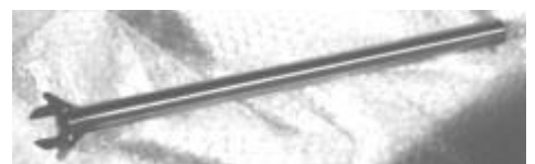
Spezialmontageschlüssel 3 HL 12

Das hagoLock ist bis zu 125 kg Körpergewicht getestet, natürlich CE-gekennzeichnet und zum Patent angemeldet.